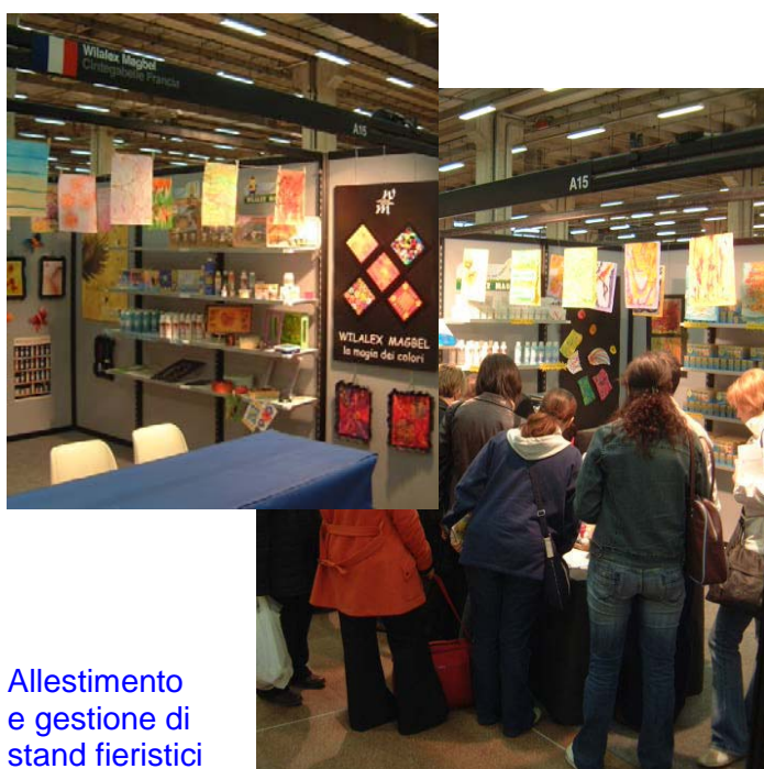
Allestimento e gestione di stand fieristici

Promec, dal 1990, organizza eventi legati al turismo, allo sport e al tempo libero. Oltre a quelli direttamente promossi, la nostra azienda svolge il ruolo di consulenza e di coordinamento organizzativo per enti pubblici ed aziende private. Per soddisfare ogni tipo di esigenza siamo in grado di studiare loghi, pianificare campagne di promozione, curare la stampa del materiale, coordinare l'intervento di specialisti e fornire personale di supporto all'evento.