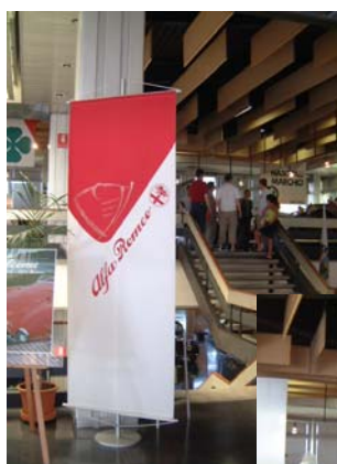
Organizzazione per la produzione di "Finalmente Domenica"